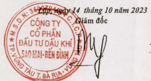
Phùng Như Dũng