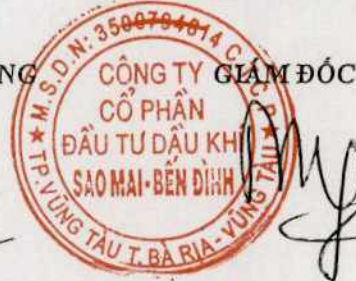
Phùng Như Dũng