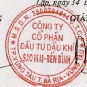
Phùng Như Dũng