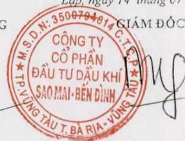
Phùng Như Dũng