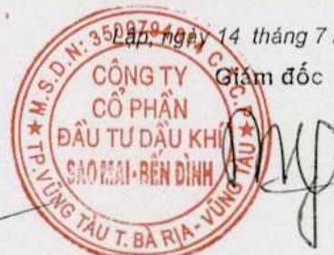
Phùng Như Dũng