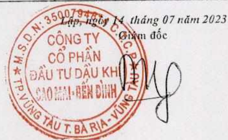
Phùng Như Dũng